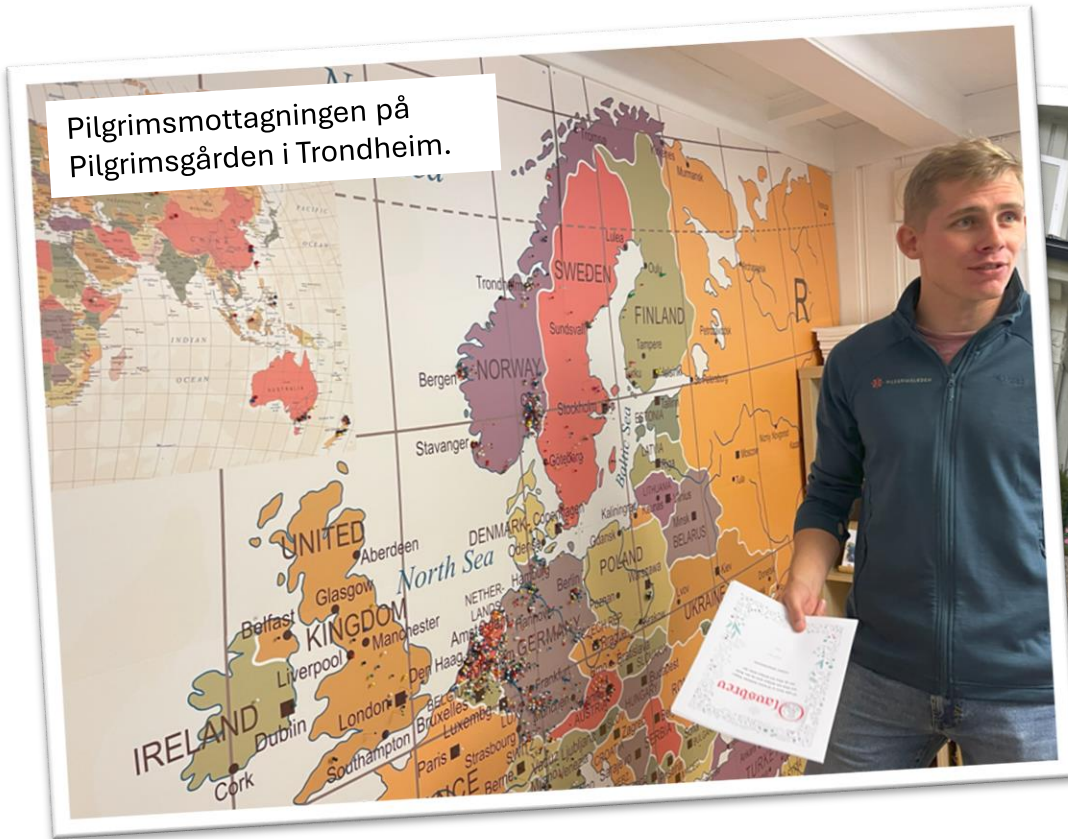
Pilgrimsmottagningen på Pilgrimsgården i Trondheim.