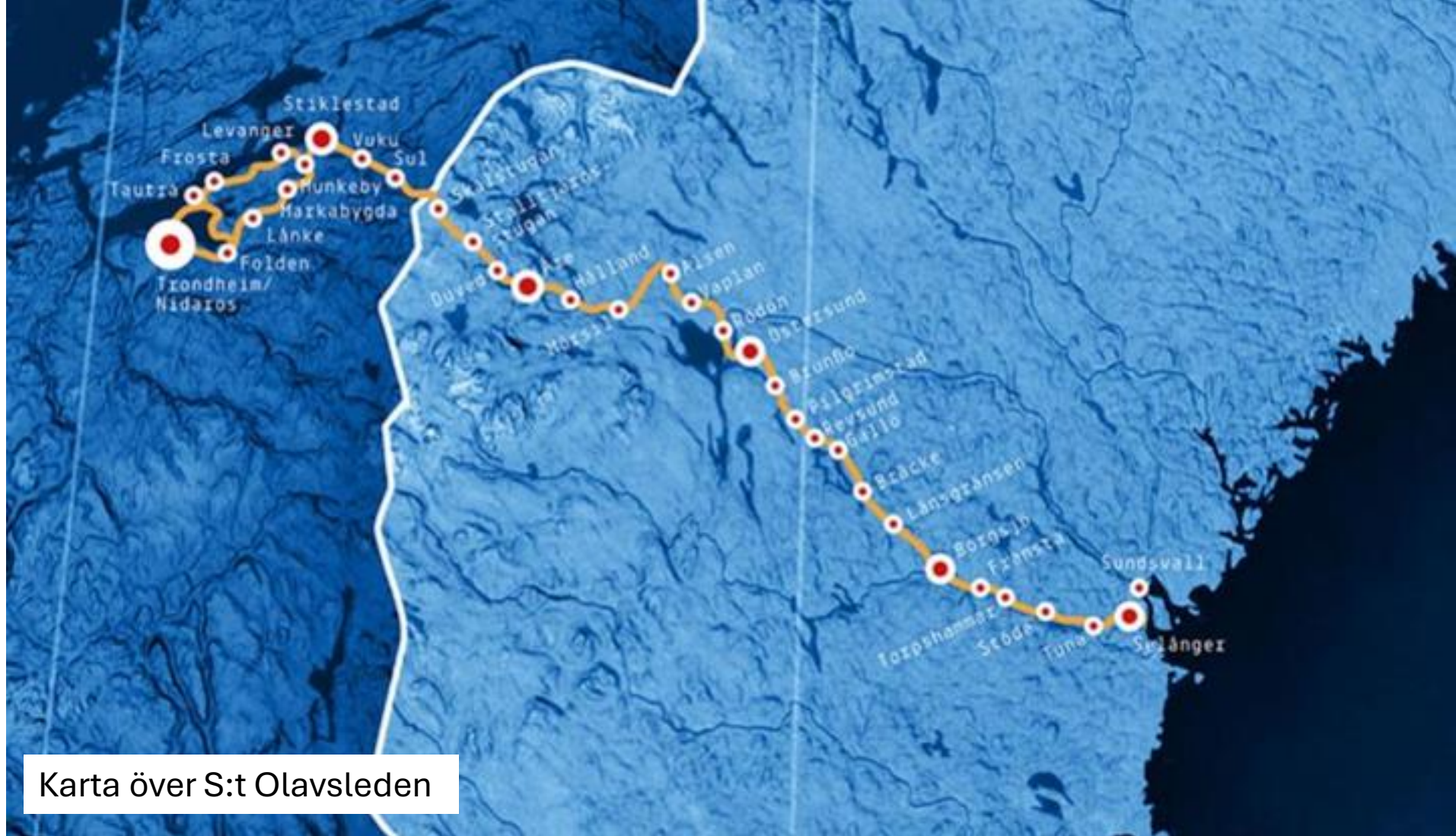
Karta över S:t Olavsleden