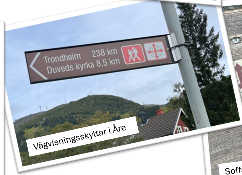
Vägvisningsskyltar i Åre