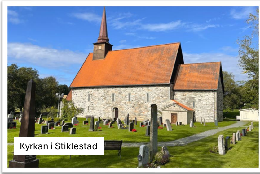
Kyrkan i Stiklestad