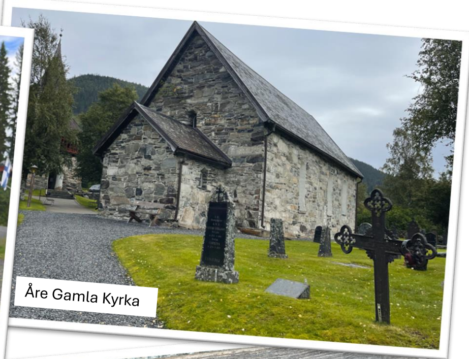
Åre Gamla Kyrka