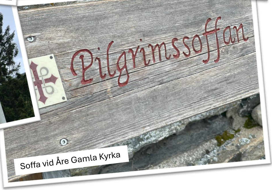
Soffa vid Åre Gamla Kyrka