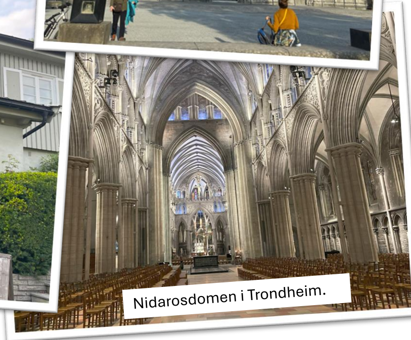
Nidarosdomen i Trondheim.