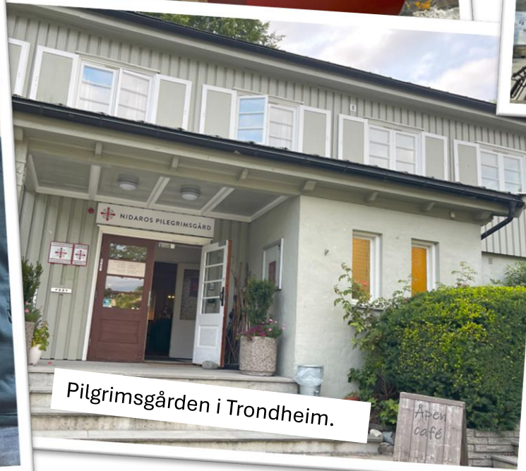
Pilgrimsgården i Trondheim.